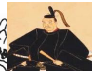
閑谷学校の創建を命じた藩主