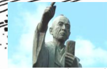
学校をつくった家臣