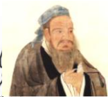
仁政を提唱した学者