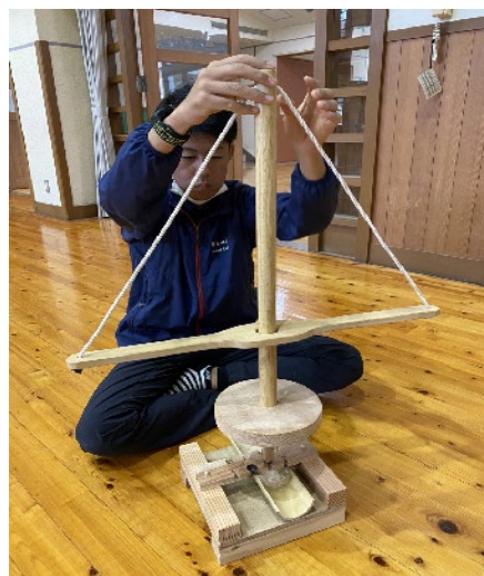
※セッティングの様子