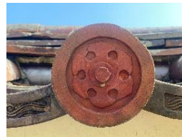
六葉紋(ろくようもん)7