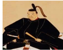
しょうみん 庶民のための学校づくり