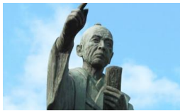
ながつぐ 永続きする学校