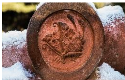
揚羽(あげは)チョウ3