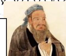
じん ろんご 仁「論語」の教えを説いた学者