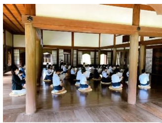
講堂学習(論語体験)