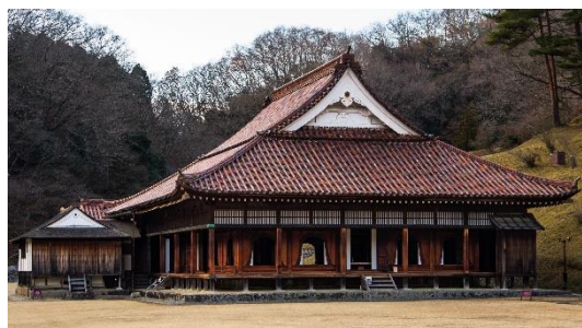
特別史跡旧閑谷学校講堂(国宝)